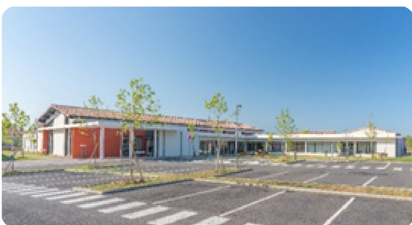
Site Saint Hippolyte

15 lits Médecine 15 lits de SSR 30 lits Unité de Soins Longue Durée 157 places en Hébergement Capacité de 6 personnes pour l'Accueil de jour 30 places pour le service de Soins Infirmiers à Domicile