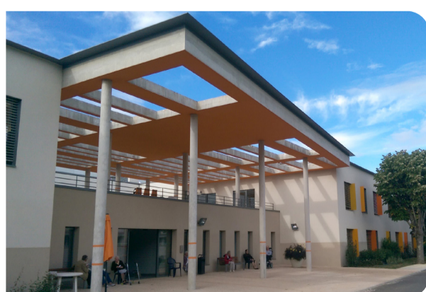
EHPAD Robert Barguisseau - La Ribère

550 lits et places dont 70 en USLD et 130 en EHPAD 85 232 journées d'hospitalisation MCO 19 412 journées d'hospitalisation SSR 65 191 passages externes 22 347 passages aux urgences 900 naissances