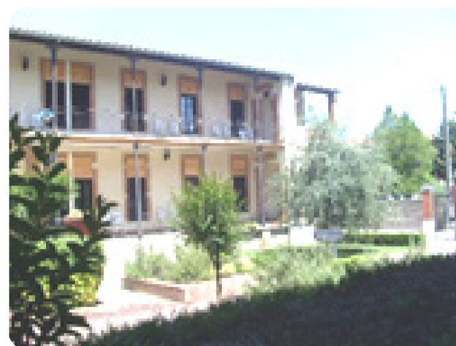
EHPAD de Lombez