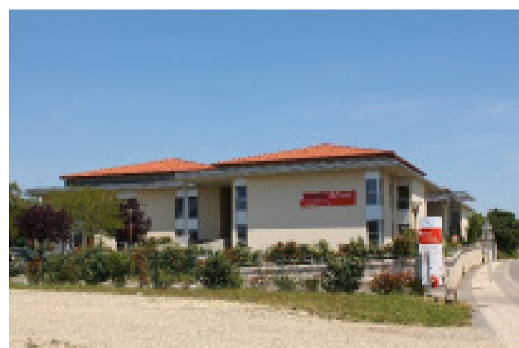
EHPAD du Tané