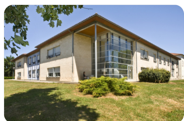
USLD Jardins d'Automne - La Ribère