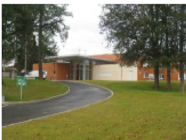
EHPAD La Pépinière