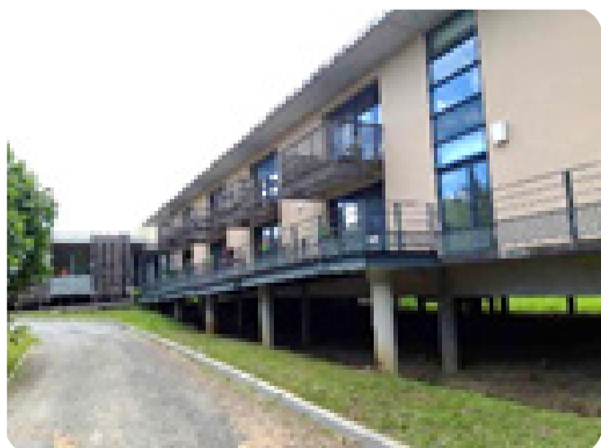
EHPAD de Samatan