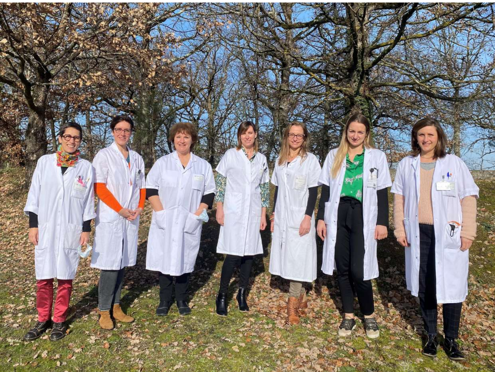
L'équipe des Psychologues