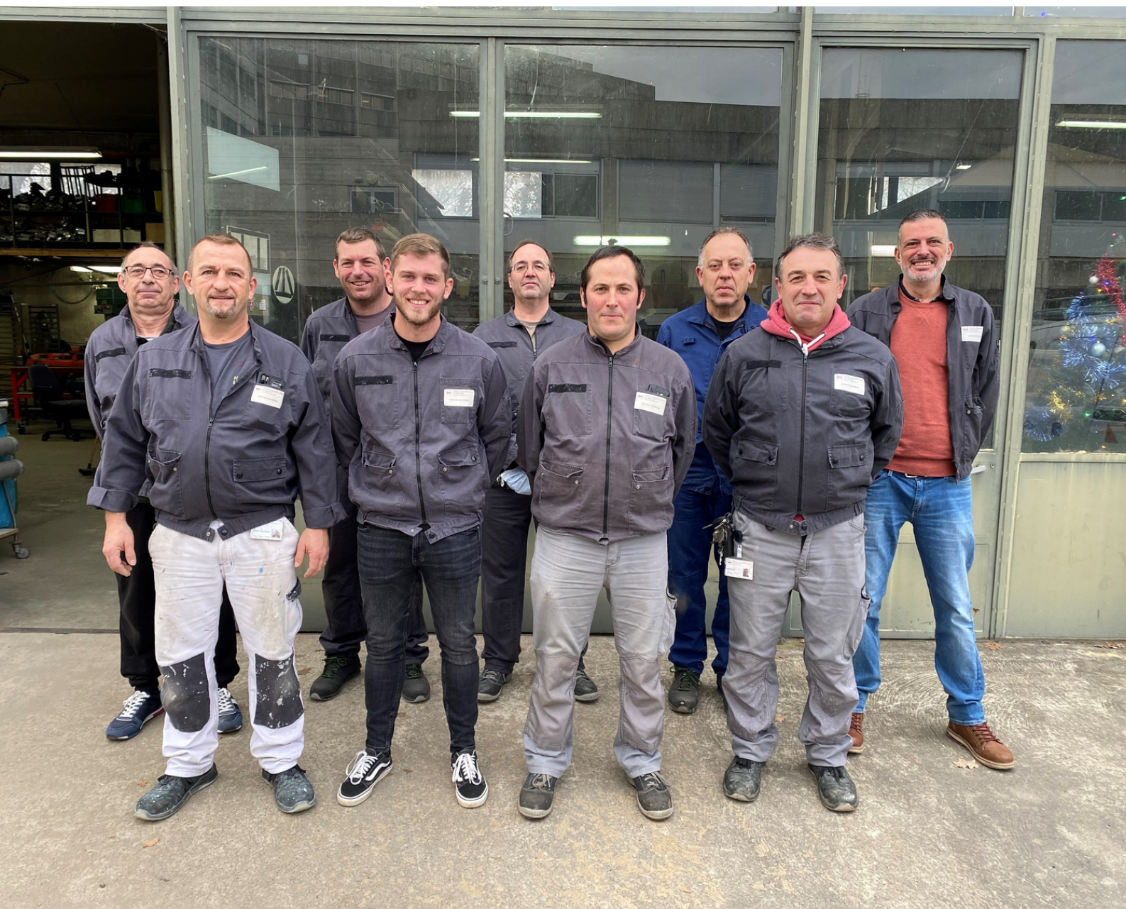
L'équipe de Génie Civil